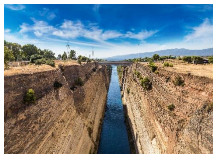
Name ...Kanal von Korinth...