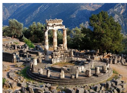
Name ...Delphi / Orakel von Delphi...