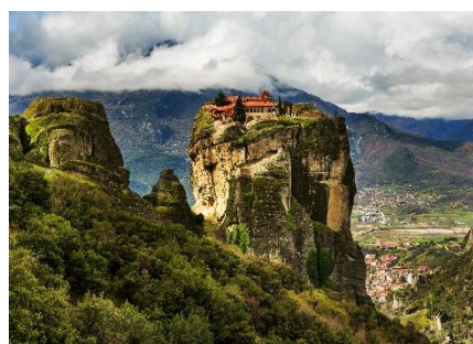
Name ...Kalambaka / Meteora Klöster...