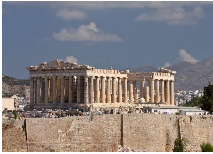
Name Akropolis / Parthenon