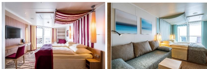
Exemple de cabine véranda

Transfert au port et embarquement à bord de l'AIDAprima. Les hébergements individuels répondant aux attentes des clients les plus exigeants se répartissent sur 17 ponts. Nous avons réservé une cabine véranda pour vous.